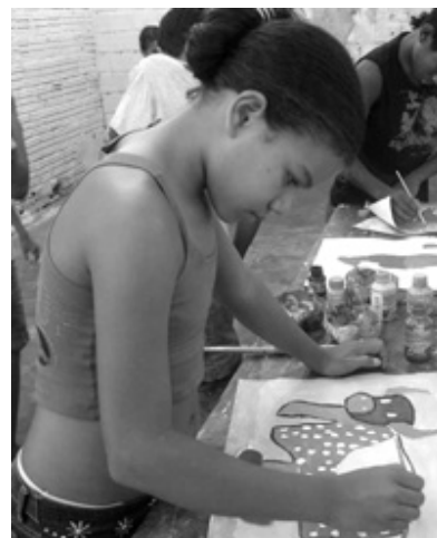
Kinderprojekt - „Projeto do Menor“ -