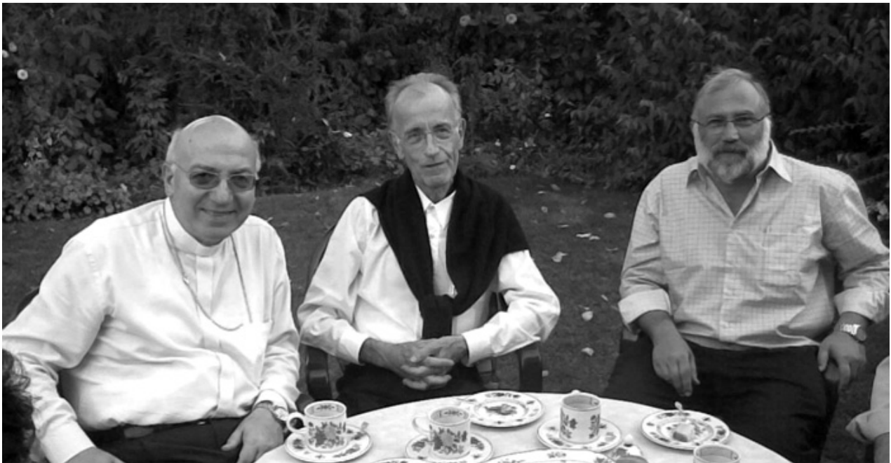
Mit liebem Besuch, kurz nach Erhalt der Diagnose

Das Motto auf dem Titelblatt ist ein Zitat von Bischof Reinhard.